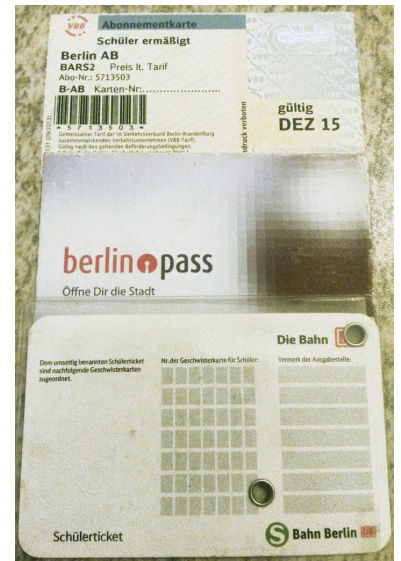
Was ein Berliner Schulkind dabei haben muss: Monatsabschnitt, Kundenkarte, Berlinpass.

Stellen Sie sich vor, ein weiteres Familienmitglied kommt zur Welt oder Sie oder Ihr Partner verlieren den Job. Oder aber durch einen Umzug zahlen Sie mehr Miete. In all diesen Fällen kann es passieren, dass Sie nun Anrecht auf Wohngeld, Kinderzuschlag oder Hartz IV haben, da sich der Bedarf erhöht oder das Einkommen verringert hat. In all diesen Fällen erhalten Sie theoretisch die Möglichkeit, für Ihr Kind statt des normalen Schülertickets (im Abo für monatlich 22,08 Euro) das ermäßigte Schülerticket (im Abo für monatlich 12,08 Euro) zu erwerben. Theoretisch. Praktisch läuft das aber wie folgt ab, hier am Beispiel eines Beziehers von Kinderzuschlag. Kinderzuschlag erhalten zum Beispiel Familien, die zwar werktätig sind, deren Einkommen jedoch knapp unter dem Hartz-IV-Bedarf liegt.