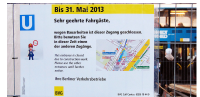
U-Bf Rathaus Steglitz. Beide Fotos wurden am Bauzaun des gesperrten Ausgangs vor der Schwartzschen Villa aufgenommen. Tatsächlich eröffnet wurde der Ausgang dann Ende Juni 2013.