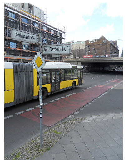
Die ansich guten Bauplakate wurden zur Formel-E wenig hilfreich überklebt - zudem auch noch einen ganzen Tag zu früh!