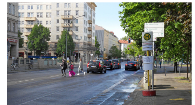
U-Bf Strausberger Platz: Von der Ankunftshaltestelle des Ersatzbusses ist der U-Bahn-Eingang äußerst ungünstig positioniert. Entweder man quert die Fahrbahn direkt, gefährlich und regelwidrig, oder man läuft zur Ampel vor und muss nach der Straßenquerung den U-Bahn-Eingang einmal komplett umlaufen.