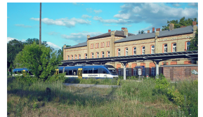
Bf. Müncheberg (Mark). Der Ausbau bzw. die Elektrifizierung der Strecke Berlin--Müncheberg--Grenze Deutschland/Polen (Ostbahn) wurden nicht in den Entwurf des BVWP aufgenommen. Begründung: Der geplante Ausbau hat keinen Nutzen für den Schienenpersonenfern- und Güterverkehr. Die Verlagerungsziele »von der Straße auf die Schiene« (vgl. EU-Weißbuch Verkehr vom 28.11.2011) werden von der Verkehrspolitik - wieder einmal - ignoriert.

Durch die im Zielnetz vorgesehenen Schienenmaßnahmen können dagegen lediglich nur rund 11 Prozent der sonst zu erwartenden Zugverspätungen abgebaut werden.