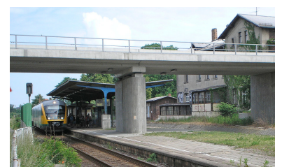
Bahnhof Horka. Die Strecke Knappenrode--Horka--Grenze Deutschland/Polen (über die Brücke führend) wird derzeit ausgebaut bzw. elektrifiziert. Eine entsprechende Ertüchtigung der Strecke Cottbus--Horka--Görlitz (unten) ist dagegen nicht absehbar, obwohl auch dieses Projekt im Rahmen der EU-Osterweiterung bereits im BVWP 2003 gelistet ist.