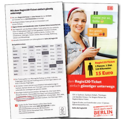
Info-Flyer zum Regio120-Ticket, gefunden am 13. Juni 2016 in einem Infokasten der S-Bahn in Leipzig. Hier wird als beteiligtes Verkehrsunternehmen ausdrücklich die »Ostdeutsche Eisenbahn« genannt. Diese Aussage war wohl voreilig. (Flyer: DB)

Auf den ersten Blick war nun alles klar. Aber bei Testbuchungen auf www.bahn.de mussten wir feststellen, dass für eine Fahrt von Salzwedel via Stendal und Rathenow nach Berlin am 13. Juni um 13:35 Uhr neben dem Flexpreis für 32,90 Euro auch das