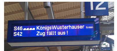
Sorgenkind Ringbahn. Auch die S-Bahn Berlin GmbH ist mit dem Verkehr auf der Ringbahn nicht zufrieden und wünscht sich dringend einen Ausbau der Infrastruktur, z. B. eine dritte Bahnsteigkante am S-Bahnhof Westend.