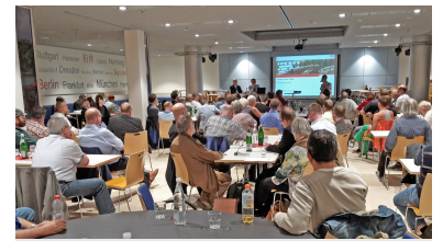
Mit über 100 Teilnehmern war der Fahrgastsprechttag S-Bahn wieder der Bestbesuchte in diesem Jahr.

Auch der Twitterkanal @SBahnBerlin wird immer beliebter. Seit Jahresbeginn ist die