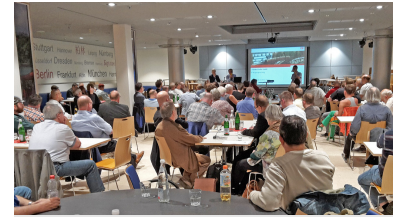
Mit über 100 Teilnehmern war der Fahrgastsprechttag S-Bahn wieder der Bestbesuchte in diesem Jahr.

Auch der Twitterkanal @SBahnBerlin wird immer beliebter. Seit Jahresbeginn ist die