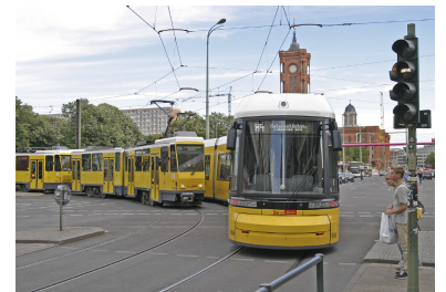
Zu kaum einem anderen Thema ist die Koalitionsvereinbarung so umfassend und präzise, wie zu Planung und Bau neuer Straßenbahnstrecken. Über 25 Jahre nach der Wiedervereinigung Berlins ist das allerdings überfällig. Dieser Wandel ist auch das Verdienst der Zusammenarbeit von Parteien und Verbänden im »Bündnis Pro Straßenbahn« (siehe SIGNAL 4/2016).

Mit dem Ziel der Leistungsverbesserung der Verkehrslenkung Berlin (VLB) wird die