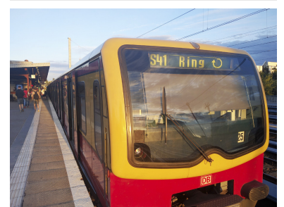
Die Ausweitung des 5-Minuten-Taktes auf der Ringbahn ist dringlich - und ebenfalls eine jahrelange IGEB-Forderung. Es bleibt zu hoffen, dass die S-Bahn Berlin auch in der Lage ist, das Angebot entsprechend auszuweiten.