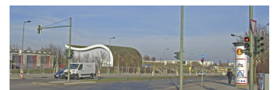
Blick vom U-Bahnausgang „Kienberg“ zur neuen Seilbahnstation, die den Namen „Kienbergpark“ tragen wird.