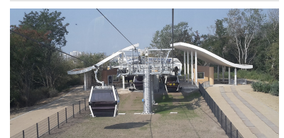
Für die Mittelstation der Seilbahn oben auf dem Kienberg ist der Name »Kienberg« vorgesehen - nicht zu verwechseln mit dem U-Bahnhof »Kienberg - Gärten der Welt« oder der Bushaltestelle »U Kienberg«. Für die Seilbahnstation wäre der Name mit Zusatz »Kienberg - Wolkenhain« sinnvoll, benannt nach der Aussichtsplattform auf dem Berggipfel.