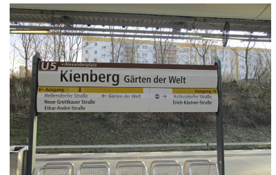
Anlässlich der 2017 stattfindenden Internationalen Gartenausstellung (IGA) in den Marzahnern Gärten der Welt wurde der U-Bahnhof »Neue Grottkauer Straße« in »Kienberg - Gärten der Welt« umbenannt. Gleichzeitig gab es einen ganzen Schwall von Haltestellenumbenennungen, die alle auf die IGA hinweisen.

Ein weiterer Umbenennungskomplex betraf die bevorstehende Internationale Gartenausstellung (IGA), die 2017 in Marzahn stattfindet und nun bereits ihre Schatten voraus warf. Der U-Bahnhof Neue Grottkauer Straße als gewünschtes Eingangstor zur IGA verliert seinen heruntergekommenen End-Achtziger-Charme