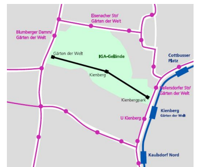
Lageplan der IGA-Seilbahn mit drei Stationen. (Grafik: Holger Mertens)