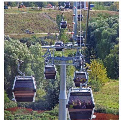
Die Umlaufseilbahn ist durch ihre kontinuierliche Abfahrt attraktiv, siehe Abb auf Seite 7.

Genauso am Blumberger Damm. Das Wohngebiet liegt auf der anderen Seite der