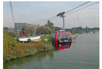
Im Herbst 2013 wurde die Seilbahn in Wrocław (Breslau) eröffnet. Sie verbindet das Hauptgelände der Technischen Universität mit dem neuen Forschungs- und Bildungszentrum »Geo-Centrum« auf der anderen Seite der Oder. 373 Meter lang, besitzt die »Polinka« genannte Anlage zwei hin- und her pendelnde Kabinen für je 15 Passagiere. Damit kann sie pro Stunde 366 Personen transportieren. Sie wird von der Hochschule betrieben, ist aber öffentlich zugänglich. Kostenlos befördert werden jedoch nur die rund 34 000 Studenten und über 4000 Mitarbeiter der TU. (Foto: Frank Lammers, Okt. 2016)

Anders in Portland im Nordwesten der USA, wo die Oregon Health and Science University bereits seit 2006 Seilbahnanschluss besitzt: Zwischen dem Kern der Stadt und einem oberhalb von ihr gelegenen Viertel überwindet die 1033 Meter lange Anlage 145 Meter Höhenunterschied und bietet eine Alternative zur engen, gewundenen Straße. Übrigens gibt es in den Vereinigten Staaten nur eine weitere innerstädtische Luftseilbahn: In New York dient sie seit 1975 der Anbindung von Roosevelt Island, einer schmalen, im East River neben Manhattan gelegenen Insel, die