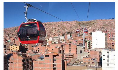
Im bolivischen La Paz hat man die Seilbahn als urbanes Verkehrsmittel entdeckt und überschwebt so das Verkehrschaos auf den Straßen.