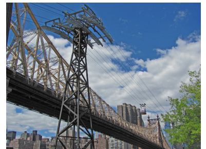
Die »Roosevelt Island Tramway« in New York verläuft parallel zur Queensboro Bridge. Die beiden Kabinen fahren unabhängig voneinander auf eigener Bahn und können aufgrund von je zwei Tragseilen im Abstand von 4,2 Metern auch bei Windgeschwindigkeiten über 80 km/h stabil fahren. Jede Kabine fasst 110 Fahrgäste und einen Fahrer.