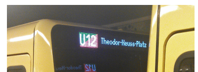
Die farbigen Liniensignets sind im verzweigten Kleinprofilnetz unverzichtbar. Die Lesbarkeit ist allerdings verbesserungswürdig. Gut funktionierende technische Umsetzungen gibt es aber am Markt.