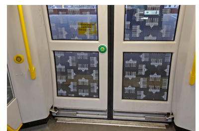
Die Türen zeigen noch ein wenig Mechanik, die Türsäulen links und rechts sind mit ihrer Platzverschwendung ein Ärgernis.