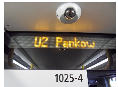
Der klassische Innenanzeiger an den Wagenenden und -übergängen ist noch immer die sinnvollste Anzeige und neben der Ansage die wichtigste Informationsquelle für die nächste Station. Darüber eine der vielen Überwachungskameras. Der Datenschutz ist durch das planmäßige Löschen nach 72 Stunden schon im Fahrzeug berücksichtigt.