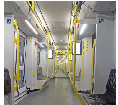
Die bewährte Ausführung als durchgängiger Halbzug prägt auch den IK. Leider verschlechtern die Monitore den Raumeindruck und die übertrieben dicke Einbautiefe verbraucht wertvolle Staufläche im Türraum.

Die Klappsitze sind dafür an die Stelle von früheren 4er-Bänken gewandert. Damit sind die Mehrzweckbereiche beim IK nun genau an der Stelle, wo sie beim ähnlich aussehenden Vorgängerfahrzeug HK gerade NICHT sind und umgekehrt. So müssen