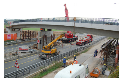
Die Mainzelbahn-Brücke über die A60 bei Marienborn ist am 17. Oktober 2015 fast fertiggestellt.