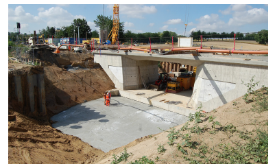
Einschieben der Unterführung der Mainzelbahn an der DB-Strecke nach Alzey am Marienborner Bahnhof am 31. Juli 2015.

Neu eröffnet wurde am 10. Dezember 2016 die ganze Strecke vom Abzweig »Agentur für Arbeit« bis »Lerchenberg«. Damit wuchs das Netz der Mainzer Straßenbahn um rund 50 Prozent. 2017 folgt die Strecke zur Endstelle »Zollhafen« (Grafik: Robert Schwandl)