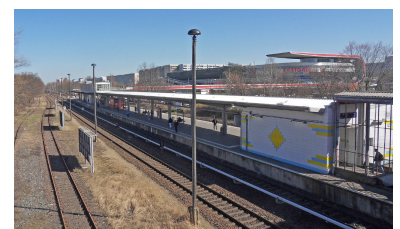
Am Verkehrsknoten und Einkaufszentrum in Marzahn fährt die RB 25 derzeit vorbei - das sollte sich ändern, um Umstiege zu reduzieren und die Attraktivität der Linie zu steigern! Der notwendige Platz ist vorhanden - schon früher hielten hier Regionalzüge.