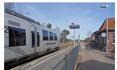
Das zweite Gleis im Bahnhof Blumberg wird für den künftig erforderlichen 30-Minuten-Takt zur Zugkreuzung gebraucht und muss beim anstehenden Umbau mit eigener Bahnsteigkante erhalten bleiben. Ohne eine Attraktivitätssteigerung wird die Straße B 158 nach ihrem Ausbau viele Fahrgäste abziehen!