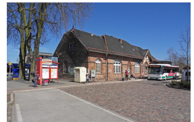
In Werneuchen bietet der Nullknoten mit kurzen Umsteigewegen zwischen Bahn (links) und Bussen (rechts) gute Voraussetzungen, doch das Bus-Angebot ist ausbaufähig. Statt im PlusBus-Standard fährt der Anschlussbus nach Bad Freienwalde nur alle zwei Stunden.

Von der Wriezener Bahn gibt es somit nur noch den Abschnitt zwischen Berlin und