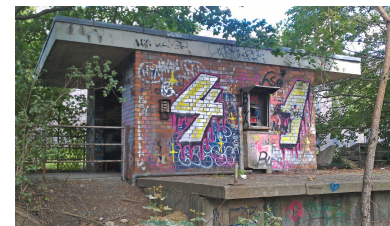
S-Bahnhof Zehlendorf Süd, 1972 gebaut, 1980 stillgelegt. Das »Empfangsgebäude«, ein Bahnsteigschild und die Bahnsteigleuchten zeugen von der einstigen Station. Wenn die Stammbahn als Regionalzugstrecke wiederaufgebaut wird, wofür es gute Gründe gibt, werden in Zehlendorf Süd allerdings nie wieder Züge halten. (Foto: IGEB (2016))

Eine »Gesamthafte ÖPNV-Untersuchung« schlägt der VBB für die Stammbahn vor. Um zu diesem Ergebnis zu kommen, hätte man allerdings keine aufwendigen Korridoruntersuchungen anstellen müssen. (Quelle: VBB-Präsentation zum Regionaldialog am 9. Juni 2017 in Bad Belzig)