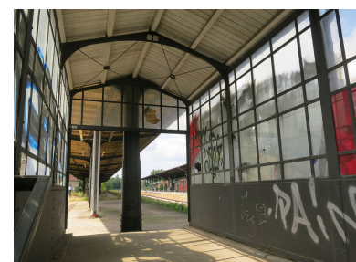
Zugang zum ehemaligen Stammbahnsteig Zehlendorf. Mit der heute Stammbahn genannten Strecke begann 1838 die preußische Eisenbahngeschichte. Nicht Nostalgie, sondern verkehrs- und umweltpolitische Argumente sprechen heute für eine schnelle Wiederherstellung dieser Strecke.