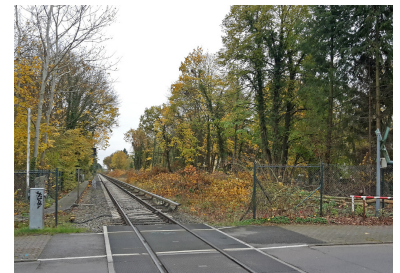
In Lichtenrade haben nach dem erfolgten Planfeststellungsbeschluss für die Dresdener Bahn die Baumfällungen auf der Bahntrasse begonnen.

Optimistisch zeigte sich Kaczmarek auch bei der Dresdener Bahn zwischen Südkreuz und Blankenfelde. Nach den jahrelangen Verzögerungen gehe die Planung für den