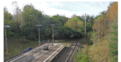
In den 1930er Jahren geplant, 2005 eröffnet - der S-Bahnhof Teltow Stadt. Die Trasse dahinter wird weiterhin freigehalten. Eine Verlängerung um zwei Bahnhöfe (Iserstraße, Sputendorfer Straße) hat derzeit gute Chancen auf Realisierung. Auch die Anbindung von Kleinmachnow und Stahnsdorf über die Stammbahn und Friedhofsbahn mit einer neuen Streckenführung entlang der A115 wurde untersucht und hätte Vorteile.

Wie häufig die S-Bahn fahren kann, hängt maßgeblich von der Auslegung der Leit- und Sicherungstechnik ab. Unterversorgte Abschnitte werden hier schnell zum Flaschenhals, wie die südliche Ringbahn zwischen Hermannstraße und Tempelhof