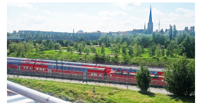
Am Gleisdreieck entstanden großzügige Parkflächen auf ehemaligen Bahnanlagen. Teilweise ist diese Nutzung nur temporär. Der Weg hinter der Tunnelausfahrt markiert in etwa den künftigen Verlauf der Stammbahn, die hier ebenfalls ans Tageslicht kommen wird. Die S 21 nutzt den Hügelrest (ehemalige Viaduktstrecke) im Vordergrund, überquert dann die Fernbahnstrecke und unterquert links die U 2-Brücke. Zugleich verzweigt sich die Strecke niveaufrei auf die Wanneseebahn und Dresdener Bahn. Die Bahnhöfe Yorckstraße benötigen zum Erhalt der Leistungsfähigkeit dann zusätzliche Bahnsteigkanten.