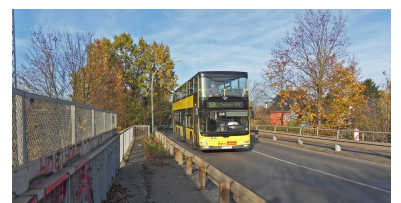
Die marode Sellheimbrücke wird von den Buslinien 150 und 158 befahren. Die Linie 350 könnte hier her verlängert werden. Die Verlängerung der S 75 wurde zwar begonnen, aber Anfang der 90er Jahre abgebrochen. Heute fehlt diese Querverbindung, die mit dem Turmbahnhof Karower Kreuz einen sinnvollen Verknüpfungspunkt hätte. Bis zur Verlängerung der S-Bahn sollte hier schnellstmöglich ein provisorischer Regionalbahnhof für die Linien RB 12 und RB 24 errichtet werden, um den bau- und staugeplagten Nordosten zu entlasten.