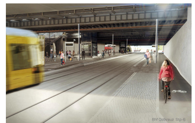
Die auf der Straßenbahnneubaustrecke wichtigste Haltestelle am Bahnhof Ostkreuz bietet wegen eines Radweges am wenigsten Platz. Müssen sich die Verkehrsmittel des Umweltverbundes gegenseitig beeinträchtigen? (Grafik: Renderwerke)