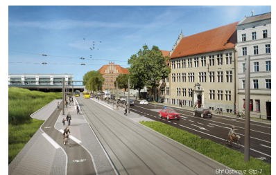
Die Haltestelle Marktstraße auf einer vorbildlichen ÖPNV-Kombitrasse, Blick Richtung Ostkreuz. In die Gegenrichtung folgt leider der Engpass Karlshorster Straße mit wahrscheinlich ÖPNV-feindlicher Signalgebung. (Grafik: Renderwerke)