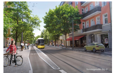
Die Sonntagstraße mit leisem Asphalt und neuer Haltestelle - sobald dort die Straßenbahn fährt. Der Radweg überquert das Haltestellenkap. (Grafik: Renderwerke)

Wenn die neue Verkehrspolitik des Senats ernst gemeint ist, dann muss der Auto-Durchgangsverkehr aus diesem Straßenabschnitt verschwinden, womit nicht nur die geschilderten Behinderungen des öffentlichen Verkehrs vermieden werden, sondern eine bessere Schaltung der beiden LSA in der Holteistraße mit kürzeren Gesamtumlaufzeiten ermöglicht wird. Nebenbei können dann die Straßenbahngleise vor diesem Bereich in der Holteistraße von Norden und in der Wühlischstraße von