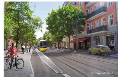
Die Sonntagstraße mit leisem Asphalt und neuer Haltestelle - sobald dort die Straßenbahn fährt. Der Radweg überquert das Haltestellenkap. (Grafik: Renderwerke)

Wenn die neue Verkehrspolitik des Senats ernst gemeint ist, dann muss der Auto-Durchgangsverkehr aus diesem Straßenabschnitt verschwinden, womit nicht nur die geschilderten Behinderungen des öffentlichen Verkehrs vermieden werden, sondern eine bessere Schaltung der beiden LSA in der Holteistraße mit kürzeren Gesamtumlaufzeiten ermöglicht wird. Nebenbei können dann die Straßenbahngleise vor diesem Bereich in der Holteistraße von Norden und in der Wühlischstraße von