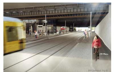
Die auf der Straßenbahnneubaustrecke wichtigste Haltestelle am Bahnhof Ostkreuz bietet wegen eines Radweges am wenigsten Platz. Müssen sich die Verkehrsmittel des Umweltverbundes gegenseitig beeinträchtigen? (Grafik: Renderwerke)