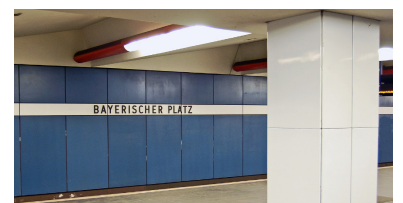
Am Bayerischen Platz liegt eine der letzten Bahnsteighallen auf dem 1971 eröffneten Abschnitt der U 7, die weitgehend im Ursprungszustand überdauert hat. Wichtig für die Entwicklung der Berliner U-Bahn-Architektur ist die Gestaltung der Decke, die an Shed- oder Sägezähndächer erinnert. Solche abgehängten Decken entfernt die BVG in letzter Zeit, weil sie neuerdings ein Sicherheitsproblem darstellen sollen. Wandverkleidungen wie die hier zu sehenden verschwinden hingegen, da sie aus Asbestzement (Markenname Eternit) sind. Dabei ist der Asbest natürlich im Zement gebunden, weshalb die Fahrgäste auch keineswegs seit Jahrzehnten einer tödlichen Gefahr ausgesetzt werden.