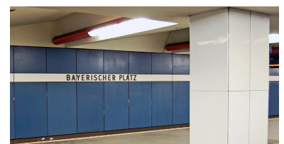
Am Bayerischen Platz liegt eine der letzten Bahnsteighallen auf dem 1971 eröffneten Abschnitt der U 7, die weitgehend im Ursprungszustand überdauert hat. Wichtig für die Entwicklung der Berliner U-Bahn-Architektur ist die Gestaltung der Decke, die an Shed- oder Sägezähndächer erinnert. Solche abgehängten Decken entfernt die BVG in letzter Zeit, weil sie neuerdings ein Sicherheitsproblem darstellen sollen. Wandverkleidungen wie die hier zu sehenden verschwinden hingegen, da sie aus Asbestzement (Markenname Eternit) sind. Dabei ist der Asbest natürlich im Zement gebunden, weshalb die Fahrgäste auch keineswegs seit Jahrzehnten einer tödlichen Gefahr ausgesetzt werden.