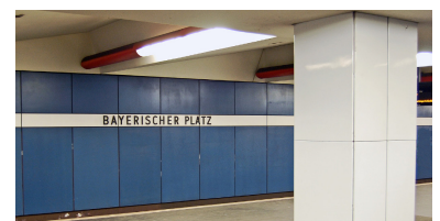
Am Bayerischen Platz liegt eine der letzten Bahnsteighallen auf dem 1971 eröffneten Abschnitt der U 7, die weitgehend im Ursprungszustand überdauert hat. Wichtig für die Entwicklung der Berliner U-Bahn-Architektur ist die Gestaltung der Decke, die an Shed- oder Sägezähndächer erinnert. Solche abgehängten Decken entfernt die BVG in letzter Zeit, weil sie neuerdings ein Sicherheitsproblem darstellen sollen. Wandverkleidungen wie die hier zu sehenden verschwinden hingegen, da sie aus Asbestzement (Markenname Eternit) sind. Dabei ist der Asbest natürlich im Zement gebunden, weshalb die Fahrgäste auch keineswegs seit Jahrzehnten einer tödlichen Gefahr ausgesetzt werden.