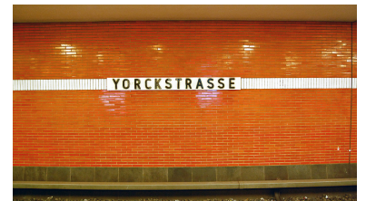
Das war einmal: Wie bei vielen Berliner U-Bahnhöfen aus den sechziger und siebziger Jahren wurde auch die originale Verkleidung der 1971 eröffneten U 7-Station Yorckstraße inzwischen abgeschlagen. Statt auf Keramikriemchen blicken die Fahrgäste hier seit über einem Jahr auf nackte Betonwände.

Anfang 2017 wurde dann der U-Bahnhof Schloßstraße unter Schutz gestellt - buchstäblich fünf nach zwölf, denn mit der Sanierung dieser 1974 eröffneten Station hatte die BVG bereits Mitte 2016 begonnen. Zu diesem Zweck waren unter anderem schon die charakteristischen Kunststoffelemente demontiert worden, die den Stationsnamen zeigten und die Reklameflächen rahmten und an den Decken und Hintergleisflächen angebracht waren - als einziger Schmuck auf dem ansonsten