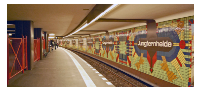
Vergangenes Jahr wurden alle 1984 eröffneten U 7-Stationen von Paulsternstraße bis Rathaus Spandau unter Denkmalschutz gestellt, vom anschließenden, bereits 1980 in Betrieb gegangenen Abschnitt jedoch nur die Bahnhöfe Rohrdamm und Siemensdamm. Dabei ist letzterer bereits stark verändert worden. Weitgehend im Originalzustand erhalten, doch noch immer schutzlos sind hingegen die Stationen Jungfernheide und Mierendorffplatz (ebenfalls 1980 eröffnet) sowie Richard-Wagner-Platz und Konstanzer Straße (1978 eröffnet). Die zwischen all diesen U-Bahnhöfen liegenden Stationen Halemweg, Jakob-Kaiser-Platz, Bismarckstraße, Wilmersdorfer Straße und Adenauerplatz wurden von der BVG bereits stark verändert oder ihre Umgestaltung ist (zum Teil seit Jahren) im Gange.