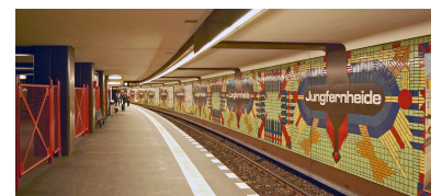
Vergangenes Jahr wurden alle 1984 eröffneten U 7-Stationen von Paulsternstraße bis Rathaus Spandau unter Denkmalschutz gestellt, vom anschließenden, bereits 1980 in Betrieb gegangenen Abschnitt jedoch nur die Bahnhöfe Rohrdamm und Siemensdamm. Dabei ist letzterer bereits stark verändert worden. Weitgehend im Originalzustand erhalten, doch noch immer schutzlos sind hingegen die Stationen Jungfernheide und Mierendorffplatz (ebenfalls 1980 eröffnet) sowie Richard-Wagner-Platz und Konstanzer Straße (1978 eröffnet). Die zwischen all diesen U-Bahnhöfen liegenden Stationen Halemweg, Jakob-Kaiser-Platz, Bismarckstraße, Wilmersdorfer Straße und Adenauerplatz wurden von der BVG bereits stark verändert oder ihre Umgestaltung ist (zum Teil seit Jahren) im Gange.