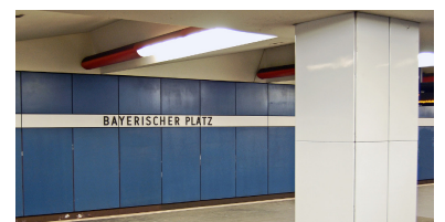
Am Bayerischen Platz liegt eine der letzten Bahnsteighallen auf dem 1971 eröffneten Abschnitt der U 7, die weitgehend im Ursprungszustand überdauert hat. Wichtig für die Entwicklung der Berliner U-Bahn-Architektur ist die Gestaltung der Decke, die an Shed- oder Sägezähndächer erinnert. Solche abgehängten Decken entfernt die BVG in letzter Zeit, weil sie neuerdings ein Sicherheitsproblem darstellen sollen. Wandverkleidungen wie die hier zu sehenden verschwinden hingegen, da sie aus Asbestzement (Markenname Eternit) sind. Dabei ist der Asbest natürlich im Zement gebunden, weshalb die Fahrgäste auch keineswegs seit Jahrzehnten einer tödlichen Gefahr ausgesetzt werden.