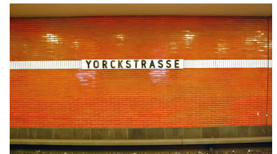
Das war einmal: Wie bei vielen Berliner U-Bahnhöfen aus den sechziger und siebziger Jahren wurde auch die originale Verkleidung der 1971 eröffneten U 7-Station Yorckstraße inzwischen abgeschlagen. Statt auf Keramikriemchen blicken die Fahrgäste hier seit über einem Jahr auf nackte Betonwände.

Anfang 2017 wurde dann der U-Bahnhof Schloßstraße unter Schutz gestellt - buchstäblich fünf nach zwölf, denn mit der Sanierung dieser 1974 eröffneten Station hatte die BVG bereits Mitte 2016 begonnen. Zu diesem Zweck waren unter anderem schon die charakteristischen Kunststoffelemente demontiert worden, die den Stationsnamen zeigten und die Reklameflächen rahmten und an den Decken und Hintergleisflächen angebracht waren - als einziger Schmuck auf dem ansonsten