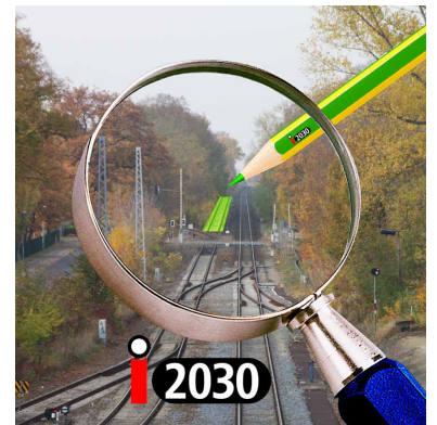
Wie hier auf der Kremmener Bahn hinter Velten gibt es viele infrastrukturelle Engpässe, die immer wieder einen stabilen Fahrplan gefährden. Diese zu beseitigen, haben sich die Länder Berlin und Brandenburg auf ihre Fahnen geschrieben und mit VBB und DB Netz das Projekt i2030 ins Leben gerufen. Was sich dahinter verbirgt.

Natürlich gab es auch schon wieder kritische Fragen, warum denn die beiden Länder