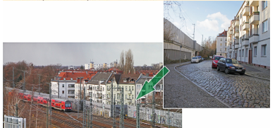
Sehr eng würde es bei zwei zusätzlichen Gleisen in der Staakener Straße werden. Es könnte ein Viadukt über der linken Straßenhälfte errichtet werden.