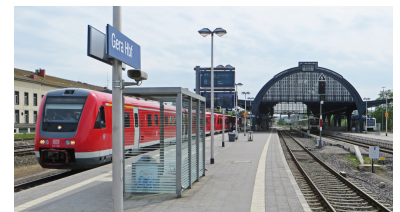
Erfreuliche Angebotsverbesserung: Seit dem Fahrplanwechsel am 9. Dezember 2018 wird die thüringische Stadt Gera (95 000 Einwohner) nicht mehr nur durch Züge des Regionalverkehrs, sondern auch überregional durch drei Intercity-Zugpaare bedient. (Foto: Christian Schultz)

Auf einem Fahrgastsprechtag im Rahmen der 35. Deutschen Schienenverkehrs-Wochen stellte Robert Ohler (Angebotskommunikation Fernverkehr, DB Fernverkehr AG) die Änderungen im Fernverkehrsangebot der Deutschen Bahn für das Jahr 2019 vor. (Grafik: DB Fernverkehr AG, September 2018)