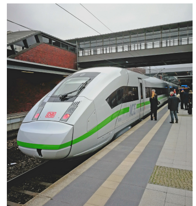
Seit 9. Dezember 2018 wird in der Relation Hamburg--Berlin--Leipzig--München erstmals auch die neueste ICE-Generation (ICE 4) eingesetzt. Damit bietet die DB in dieser stark nachgefragten Relation eine höhere Sitzplatzkapazität. Mit dem ICE 4 ist endlich wieder eine (allerdings begrenzte) Fahrradmitnahme möglich. Dies sollte zur Förderung des Umweltverbundes eigentlich eine Selbstverständlichkeit sein.