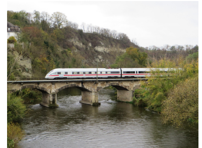
Trügerische Idylle. Nach Inbetriebnahme der Neubaustrecke Erfurt--Ebensfeld(--Nürnberg) sind die Städte im Saaletal auch 2019 weitgehend vom Fernverkehr abgeschnitten. Erst mit der stufenweisen Umsetzung des Deutschland-Taktes bestehen Chancen für Korrekturen.

Schon jetzt unsinnig sind die noch immer bestehenden Flüge in der Relation Berlin--Nürnberg. Diese sind nicht mehr zu rechtfertigen!