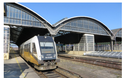
Unverständlich: Einerseits wird auf polnischer Seite die Strecke Wegliniec--Zgorzelec bis Ende 2019 elektrifiziert, andererseits wird auf deutscher Seite die Schließung der Elektrifizierungslücken ab Grenze Deutschland/Polen seit Jahren verschleppt. Dies gilt selbst für die fehlenden rund 1000 Meter zwischen den Bahnhöfen Zgorzelec und Görlitz (im Bild).