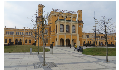
Breslau Hbf. Mit der Nightjet-/Eurocity-Verbindung Berlin--Wien/Budapest/Przemysl besteht seit dem Fahrplanwechsel am 9. Dezember 2018 u. a. wieder eine täglich verkehrende Direktverbindung Berlin--Wrocław (Breslau). Die inzwischen deutlich verbesserte Infrastruktur wird hoffentlich bald für weitere Verbesserungen des Angebots genutzt.

Ein vergleichbares Problem besteht derzeit u. a. beim eingleisigen Streckenabschnitt