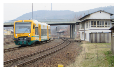
Bahnhof Löbau (Sachs). Auch die Strecke Dresden--Löbau--Görlitz--Grenze D/PL erfüllt nicht die Kriterien für die Aufnahme in den Vordringlichen Bedarf des Bedarfsplans im Bundesschienenwegeausbaugesetz. Geplant ist nun, die Elektrifizierung im Rahmen des angekündigten Sonderprogrammes des Bundes zu realisieren.