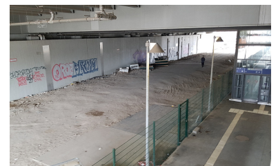
Baustelle Straßenbahn: Wohl noch Jahre wird es dauern, bis auf dieser Fläche neben den Regionalbahnsteigen der Ostbahn endlich Straßenbahnen halten. Das Planfeststellungsverfahren für die Verlegung der Trasse von der Boxhagener in die Sonntagstraße kommt nur langsam voran.