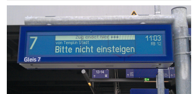
Mangelhafte Fahrgastinformation: Angezeigt wird die unwichtige Information, dass hier am Gleis 7