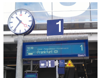
Unverständlicher Mangel. Am Gleis 1 und 2 fahren in jeder Richtung stündlich fünf Regionalzüge und die (bisher wenigen) Fernzüge von Flixtain ab. Auf fast allen Berliner Fern- und Regionalbahnhöfen wurden inzwischen Zugzielanzeiger aufgehängt, die auch die beiden Folgezüge anzeigen. Nur in Ostkreuz, einem der bedeutendsten Bahnhöfe im Netz der Deutschen Bahn, wurde darauf verzichtet.