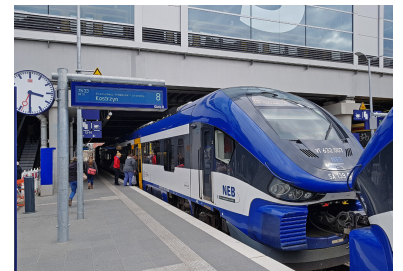
RB 26 nach Kostrzyn in Ostkreuz. Seit dem 9. Dezember 2018 können nun auch die Fahrgäste auf der Ostbahn über Lichtenberg hinaus bis Ostkreuz durchfahren und damit vielfach Zeit sparen.

Weniger erfreulich ist ein weiteres Kapitel in der Dächer-Posse, aber auch hier ist die Situation nicht aussichtslos. Das noch fehlende planfestgestellte Dach über dem südlichen Regionalbahnsteig Ru (Gleise 1+2) soll noch errichtet werden, so dass auch die Fahrgäste der wichtigen Linien RE 1, RE 2, RE 7 und RB 14 nicht länger mehrheitlich am nicht überdachten Bahnsteig ein- und aussteigen müssen. Doch es bleibt die grundsätzliche Frage für alle Bahnhöfe der Deutschen Bahn: Wann endlich verstehen Bundesverkehrsministerium und Bahn die Bedeutung einer Bahnsteigüberdachung für die Fahrgäste - nicht nur bei Regen, sondern auch bei Hitze?