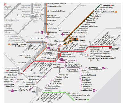
In der Bauphase der Sperrung der Altstadt Köpenick war ein Großteil des Straßenbahnnetzes in Köpenick gesperrt.