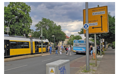
Erst hier sollen die Fahrgäste in die Straßenbahn Richtung Mahlsdorf einsteigen. Mit dem üblichen hastigen Übergang vom verspäteten SEV zur Straßenbahn. Ob sie auch wartet?