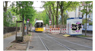
Hier am Lienhardweg entstand diese Stumpfendstelle. Wer zügig nach Wendenschloß will, steigt lieber hier aus und läuft zu Fuß weiter, statt 8 Minuten auf den SEV zu warten.

Nach Beendigung der Baustelle Bahnhofstraße konnte die 61 jedoch weiterhin nicht in ihrer originalen Linienführung durch den Müggelseedamm fahren: Am 5. Juni gab die