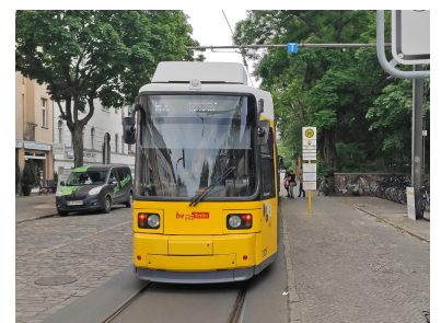
Eine Szene, die sich hier wahrscheinlich besonders in der ersten Woche alle 10 Minuten abspielte. Fahrgäste fragen das Fahrpersonal, ob sie schon einsteigen können.